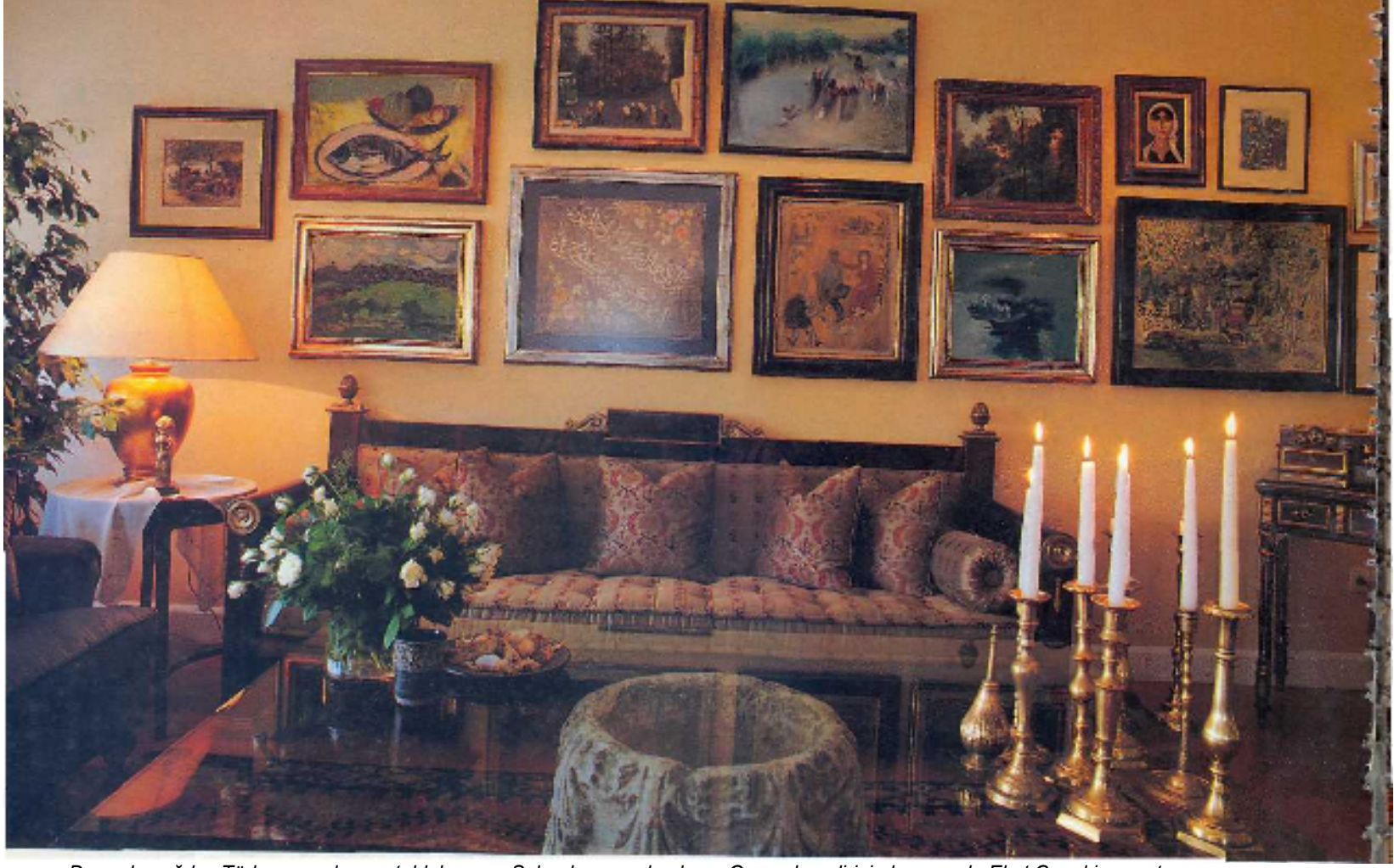
Duvarda çağdaş Türk ressamlarının tabloları var. Salonda maun kaplama Osmanlı sedirinin kumaşı da Ekat Cupal imzası taşıyor. Şamdanlar Osmanlı dönemine ait (üstte) • Evin yemek bölümünden bir görünüm... Yemek masası Metin Kaşo'dan. Tavandaki lamba Fevzi Yağcı dan alınmış. Bu lambanın bir diğer eşi de Atatürk'ün Selanik'teki evinde bulunuyor. Duvarda Osmanlı bahriye nezareti için yapılmış tabaklar asılı (altta).